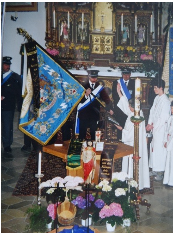
Weihe der restaurierten Fahne (2004)